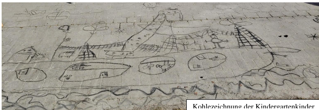
Kohlezeichnung der Kindergartenkinder

Kinderland Arche Noah ist ein Kinderhaus mit aktuell 99 Betreuungsplätzen für Kinder von ca. einem Jahr bis zum Schuleintritt. Davon sind fünf Integrationsplätze für Kinder mit einem besonderen Förderbedarf. Es gibt drei Kindergartengruppen für insgesamt 75 Kinder sowie zwei Krippengruppen für 24 Kinder. Die Kinder sind festen Gruppen zugeordnet, die Gruppen selbst sind altersgemischt. Das Haus wurde 1997 eröffnet, im September 2015 wurde die Einrichtung um einen Anbau für zwei Krippengruppen erweitert. Im Januar 2016 übernahm die Kinderland PLUS gGmbH vom Diakonieverein Anzing die Trägerschaft für die Einrichtung, nachdem eine ehrenamtliche Geschäftsführung für die Einrichtung nicht mehr zu leisten war. Am 01.01.2023 wurde der Diakonieverein aufgelöst und die bis dahin bestehende Kooperationsvereinbarung beendet. Dennoch finden weiterhin die regelmäßigen (ca. 2x jährlich) ökumenischen Gottesdienste, zur Vermittlung des christlichen Weltbildes, mit unserem evangelischen Pfarrer aus Anzing statt. Der Hausschwerpunkt ist die Natur und Umwelt.